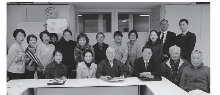
▲2/9 事業者協議を終えて。6階建て案への計画見直しに笑顔!!